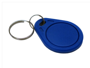
RFID-Tag RFID Transponder 13,56MHz