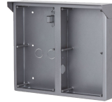
L-RA-5704-AP Aufputzrahmen für Modular Türstationen