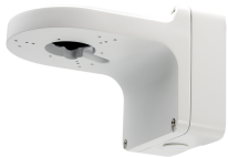
L-WH15 Wandhalter mit Anschlussbox