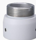
L-HA7 Adapter für Domekameras