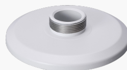
L-HA3 Adapter für Dome Kameras