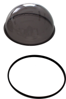
L-SCE Umrüstset für Dome Kameras