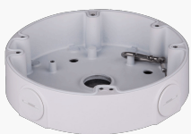
L-AB9 Anschlussbox für luna Kameras