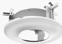
L-DE2 Stabiler Domehalter für Deckeneinbau