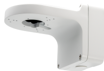
L-WH15 Wandhalter mit Anschlussbox