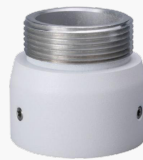
L-HA7 Adapter für Domekameras